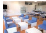
コミュニティコーナー