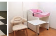
赤ちゃんスポット