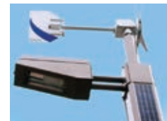
自然エネルギーの外灯