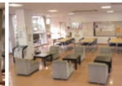
コミュニティコーナー