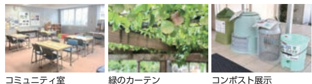
コミュニティ室 緑のカーテン コンポスト展示