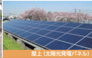
屋上(太陽光発電パネル)

環境に優しい風力発電・太陽光発電を備えた施設です。地域には小学校が多く、環境やリサイクルをテーマにした出前講座も活発に行っています。